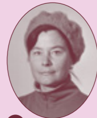
11 PIRKKO KOLBE (1932–2008) Riihimäen tyttölyseo