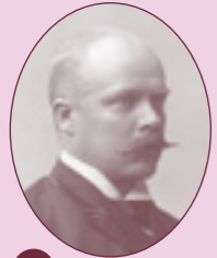
1 K. a. TAVASTSTJERNA (1860–1898) Ryttylän kartano