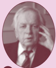
10 VEIJO MERI (1928–2015) Hausjärven Ryttylän Uittamo