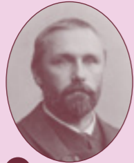
2 ARVID JÄRNEFELT (1861–1932) Kalkeen tila Hausjärven Hikiällä