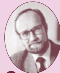
13 AARO VAKKURI (1943–2002) Omakotitalo Lasitehtaan ja Sakon välissä